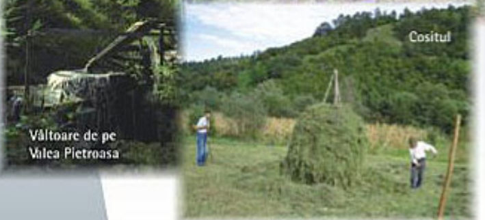
Vâltoare de pe Valea Pietroasa